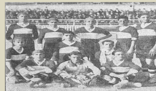
Unione Sportiva San Pasquale Bari I colori sociali, foto formazione e foto Stadio “Campo di San Lorenzo”