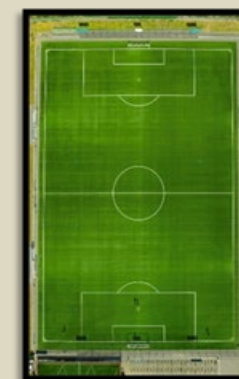
Unione Sportiva Biscegliese I colori sociali, foto formazione e foto Stadio "Campo F. Di Lido" non disponibile