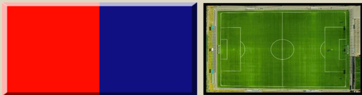
Unione Sportiva Acquavivese I colori sociali, foto formazione e foto Stadio "Campo di Via Trani" non disponibile

Per alcune Società calcistiche attualmente non è stata ritrovata nelle fonti consultate immagini dei loghi e di eventuali formazioni