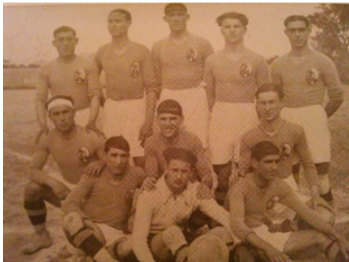
Centro Sportivo «Tommaso Gargallo» Il Logo, foto formazione e foto Stadio «Campo Coloniale»

Per alcune Società calcistiche attualmente non è stata ritrovata nelle fonti consultate immagini dei loghi e di eventuali formazioni