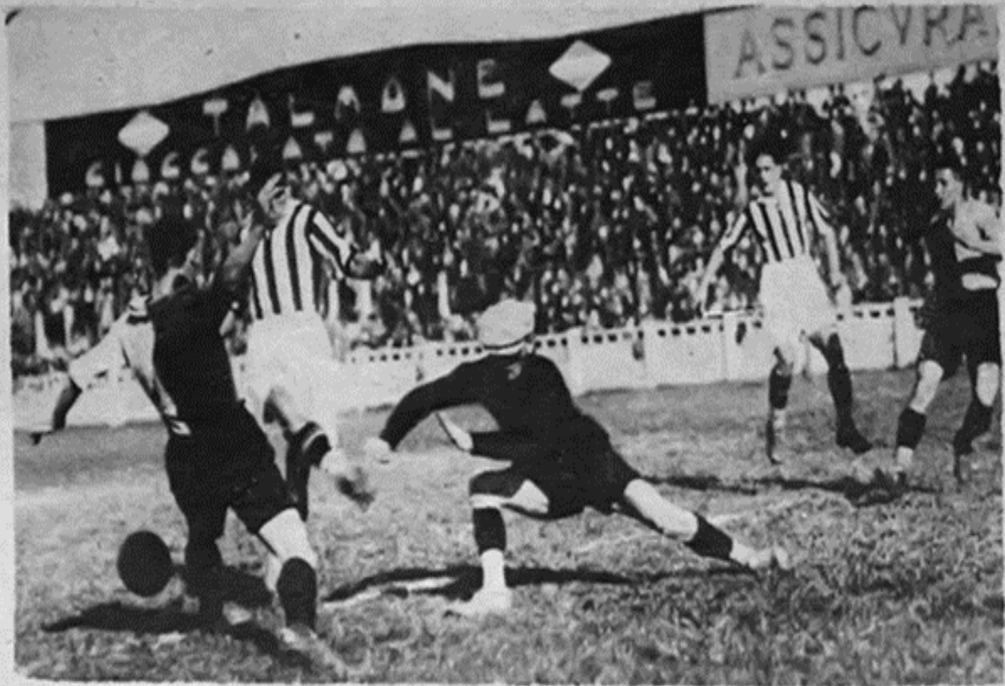
La strepitosa vittoria della Juventus sulla Fiorentina: un pericoloso tiro di vojac annullato dall'intervento di Pieri