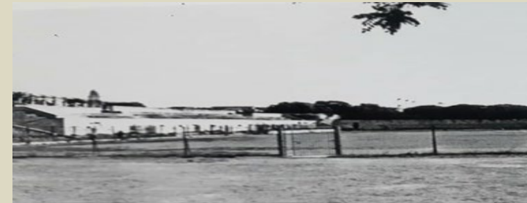
Unione Sportiva Lecce I colori sociali, foto formazione e foto Stadio “Achille Starace”