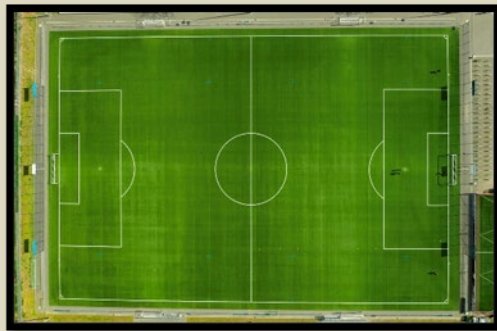
Unione Sportiva Pro Gioia Il Logo, foto formazione e foto Stadio “Littorio” non disponibile