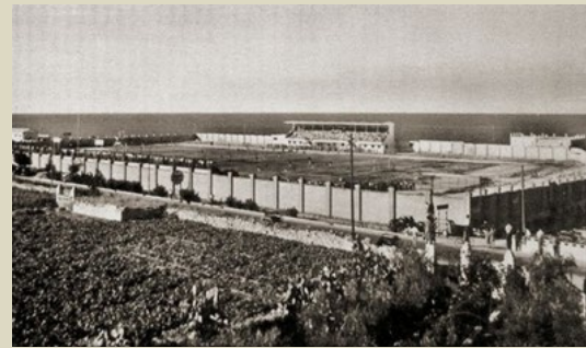
Unione Sportiva Fulgor Molfetta Il Logo, una formazione, lo Stadio «P. Poli»