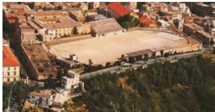
Unione Sportiva Massangioli