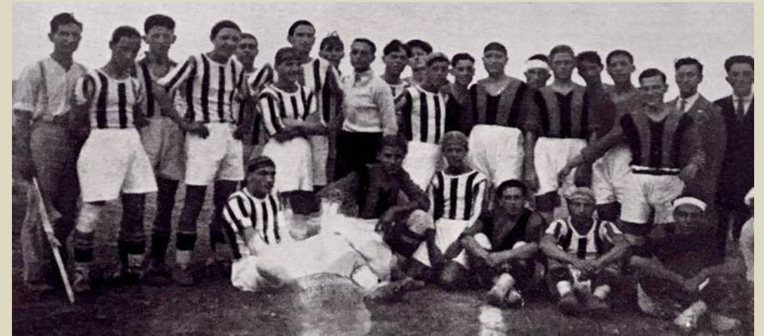
La foto ritrae le due compagini prima dell'inizio della gara amichevole

Note: Stadio Poli – Inizio gara ore 15:30 – Pubblico numeroso – Nel s.t. annullata una rete a Poli (B)